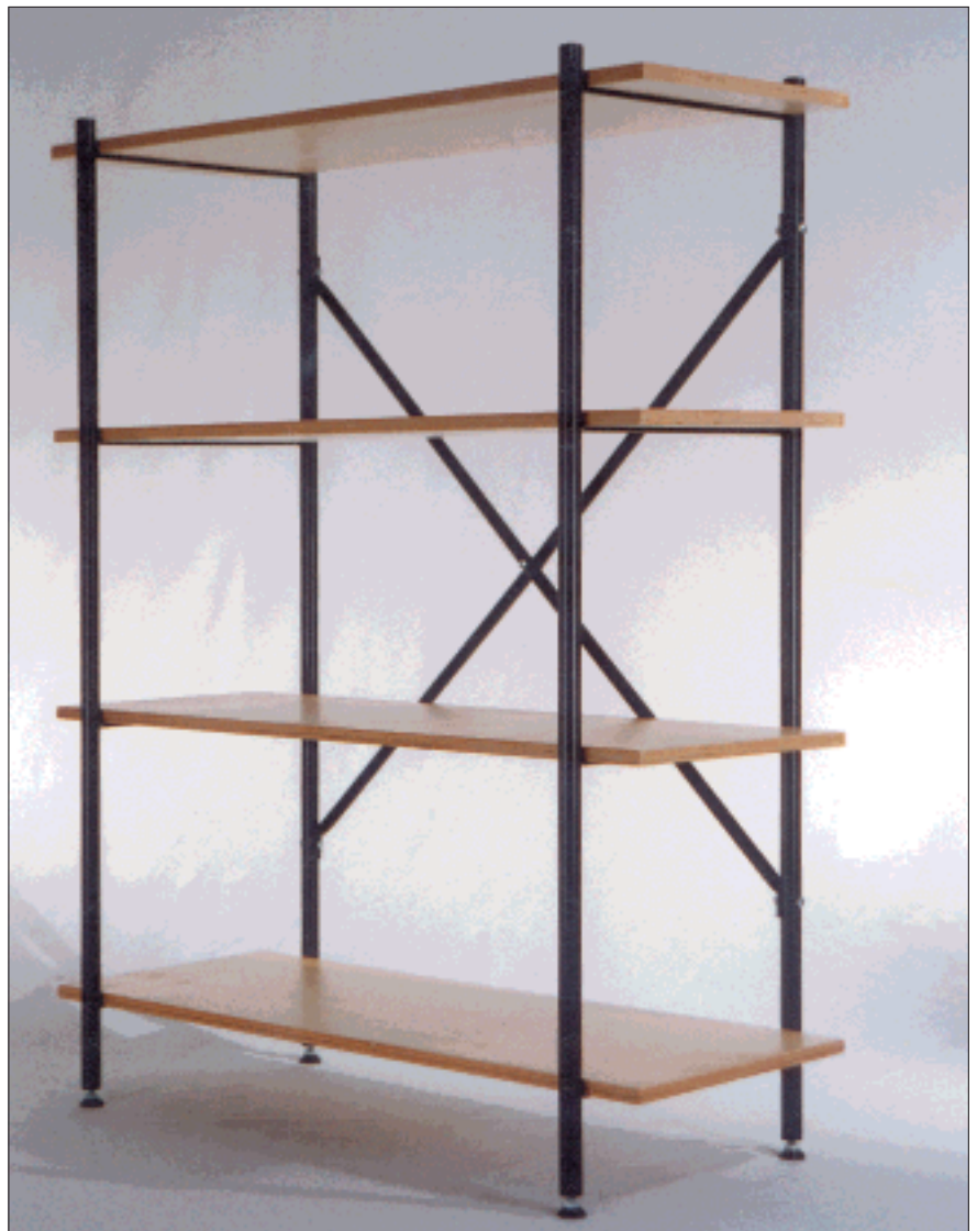
Regal »E« mit 4 Böden

Das Regalsystem »E« bildet die ideale Ergänzung zum Eiermann-Tischgestell und anderen filigranen Möbeln.