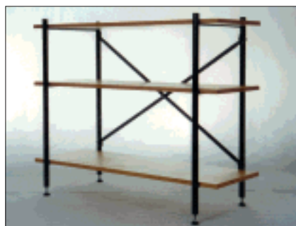
Regal »E« mit 3 Böden