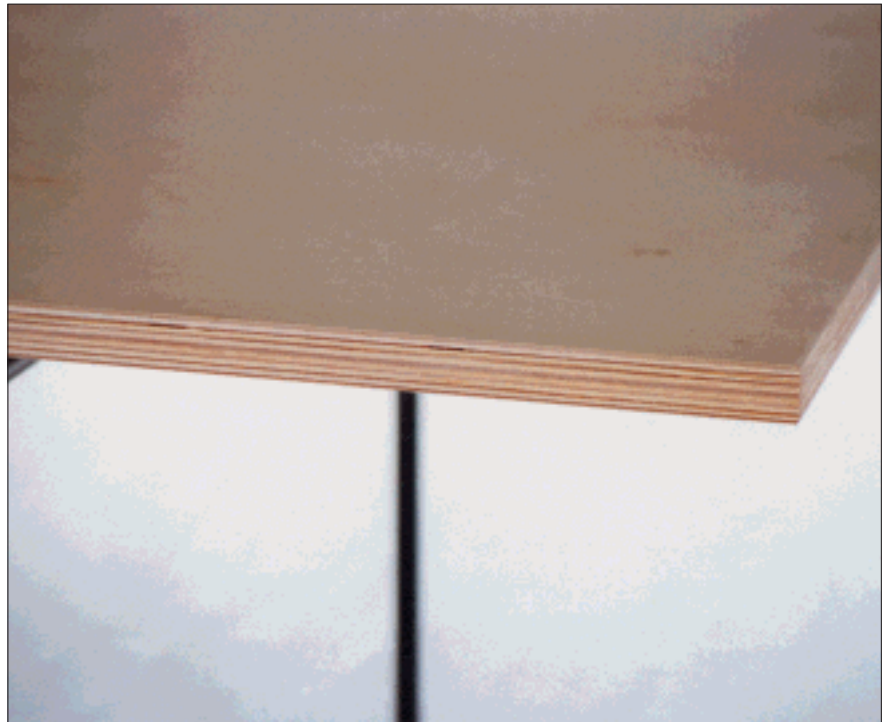
Multiplexplatte, seidenmatt klar lackiert

Dank ihres hohen Eigengewichtes bleibt die Platte auch bei einseitiger Belastung sehr kippstabil.