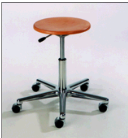
Drehhocker WS 3020

Das Werksitz-Programm entspricht der Arbeitsstuhlnorm DIN 68877 und berücksichtigt die neuesten Erkenntnisse der Arbeitsmedizin.