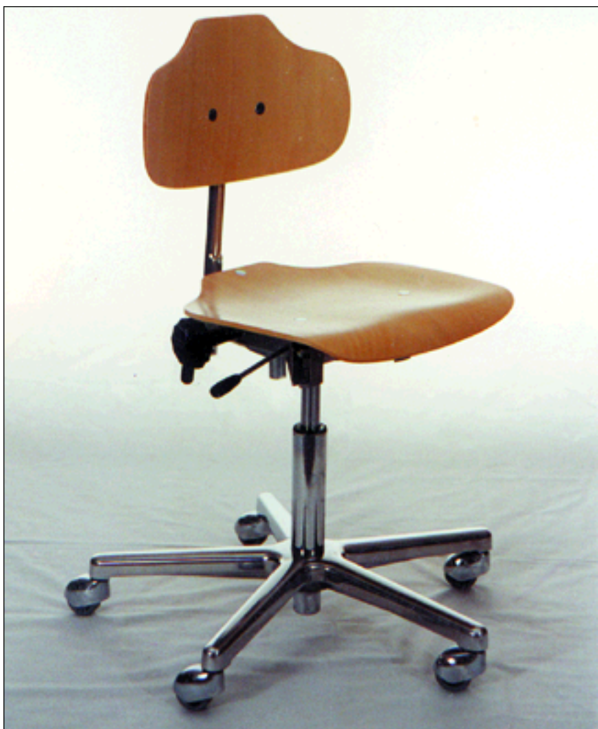
Bürodrehstuhl WS 1020 Plus